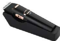
Hair Clipper AD 2832