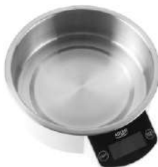
Kitchen Scale AD 8121