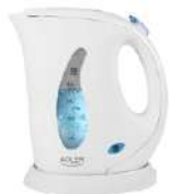
Electric Kettle AD 02