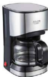
Dripp Coffee Maker AD 4407