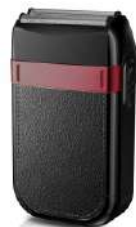
Hair Shaver AD 2932