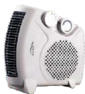
Diet Kitech Scale AD 3133