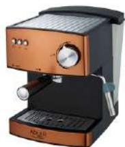
Espresso Machine AD 4404