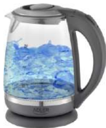
Kettle AD 1286