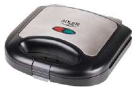
Sandwich maker AD 3015