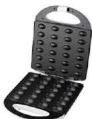
Nut Cookie Maker AD 3039