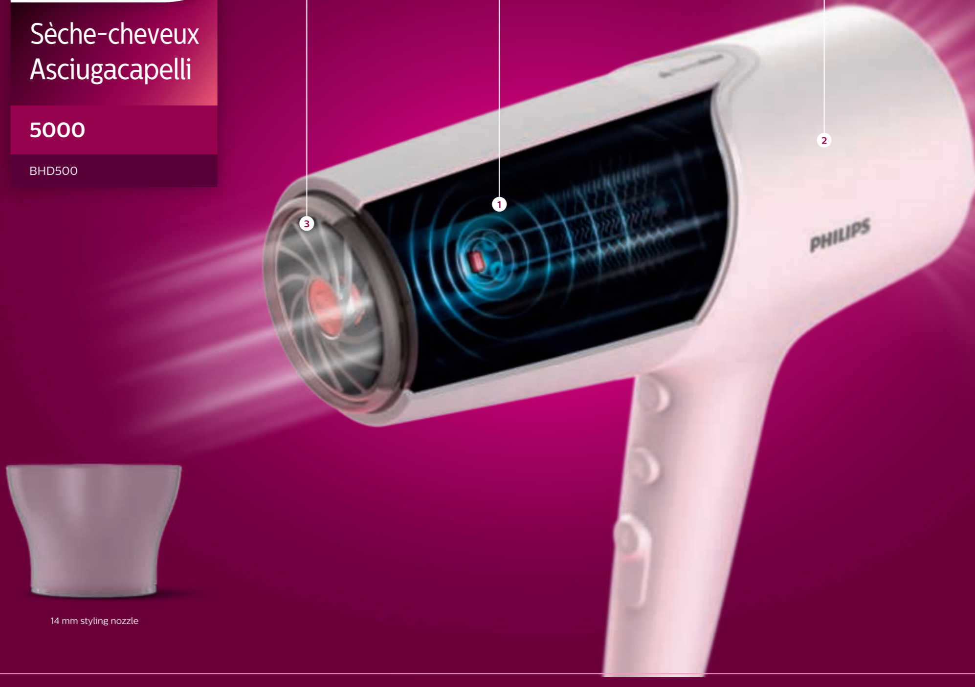
14 mm styling nozzle

2X Powerful ionic system emits two times ionic**