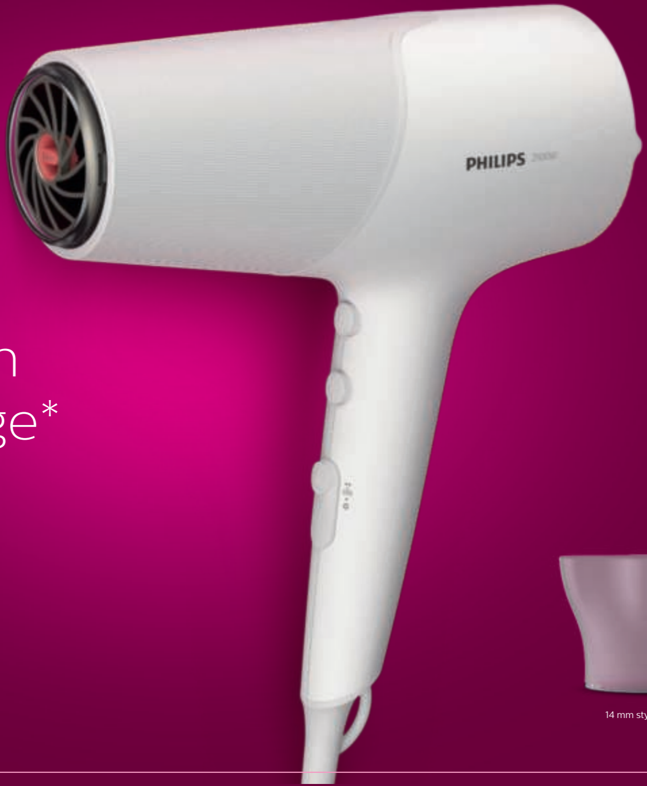
14 mm styling nozzle

Σεξούρ μαλλιών. Γρήγορο στέγνωμα χωρίς φθορά από τη θερμότητα με τεχνολογία ThermoShield. 1. Η τεχνολογία ThermoShield προστατεύει από την υπερθέρμανση, ελέγχοντας ενεργά τη θερμοκρασία αέρα του σεξούρ σε βέλτιστο επίπεδο. 2. Ταχύτερο στέγνωμα με πανίσχυρο ροή αέρα 2100 W. 3. Το πανίσχυρο σύστημα ιόντων εκπέμπει δύο φορές περισσότερα ιόντα**. Περιλαμβάνει στόμιο για styling **vs με παλιό στεγνωτικό σε φυσικό αέρα. **vs. BHD350