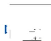
Hoogte 158,6 mm

Ergonomisch en stabiel: de verstelbare voet zorgt voor een gezonde lichaamshouding. U kunt de monitorvoet precies in die stand draaien en kantelen die voor uw rug, uw nek en uw zithouding het meest comfortabel is. De voet is bovendien traploos in hoogte verstelbaar en de monitor kan bijna tot op de bodemplaat van de voet worden verlaagd. Zo kunt u de bovenste regel in uw beeld net onder uw ooghoogte plaatsen voor een optimale ergonomische monitorpositie.