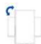
Rotatie Rotatie 90° (right and left)