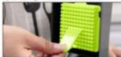
De borstel is geschikt om overblijfsels te verwijderen.