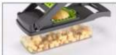
Het snijblad van 14mm is geschikt voor Kaas, komkommer, fruit, etc.