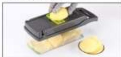
Het kartmes is geschikt voor het snijden van gekarteld voedsel, zoals aardappel en zoete aardappel.