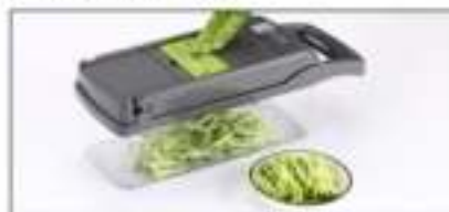
De 3mm rasp is geschikt voor kleine frietjes, radijs, etc.