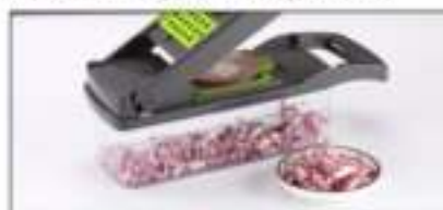
De fritsnijder is ook geschikt voor ui en blokjes vlees.

Volg alstublieft de instructies voor optimaal gebruiksgemak.