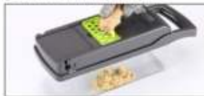
De fijne rasp is geschikt voor het raspen van bijvoorbeeld gambier, knoflook en kruiden.