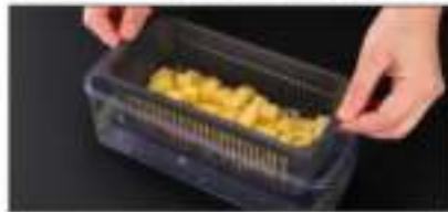
Met de zeef kunt u uw gewassen voedsel zeven.

Multifunctionele groentesnijder. Gemaakt van hoogwaardig materiaal. Gemaakt van duurzaam materiaal.