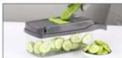
De rasp van 2mm is geschikt voor wortels, komkommer, wortel, etc.