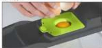
Met de eiwit filter kunt u eiwit van eigeel scheiden.