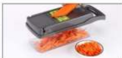
De rasp van 4mm is geschikt voor sla, komkommer, wortel, etc.