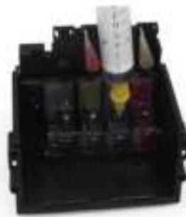
Voor Lexmark Printers