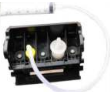
Voor Canon en HP Printers