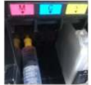
Voor Brother Printers