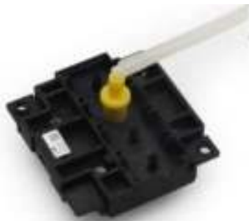
Voor Epson Printers