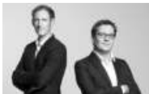
Design by Bernard / Burkhard

Thanks to all people involved in this project: Del Xu for the organisation in Asia, John Ye for the development, engineering and CAD work, Mario Rothenbühler for the photos, Fabian Bernhard and Thomas Burkard for the beautiful slim design, Matti Walker for the graphic work.