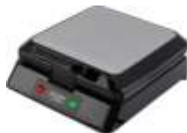
Waffle Maker AD 3036