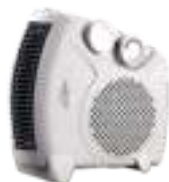
Fan Heater AD 77