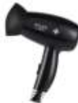
Hair Dryer AD 2251