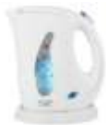
Electric Kettle AD 02