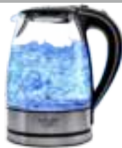
Electric Kettle AD 1225