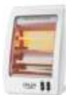
Quartz Heater AD 7709