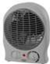
Fan Heater AD 7717