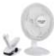
Desk fan 15 cm with clip AD 7317