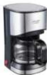
Dripp Coffee Maker AD 4407