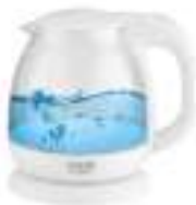
Water Kettle 1,0L AD 1283