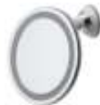
Led Bathroom Mirror AD 2168