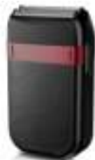
Hair Shaver AD 2932