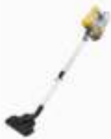
Bagless Vacuum AD 7036