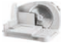
Food Slicer AD 4701