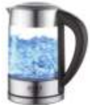
Water Kettle AD 1247 NEW