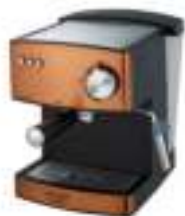
Espresso Machine AD 4404