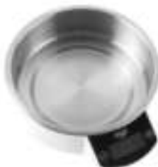
Kitchen Scale AD 8121