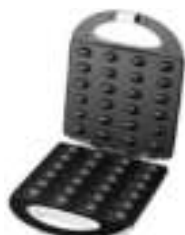
Nut Cookie Maker AD 3039