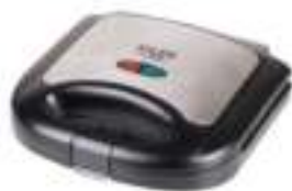
Sandwich maker AD 3015