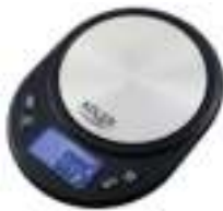
Precision scale AD 3162