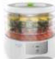
Food dryer AD 6654