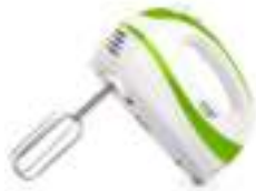
Mixer AD 4205