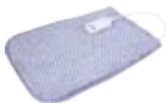
Electric heating pad AD 7415