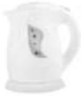
Electric Kettle AD 08