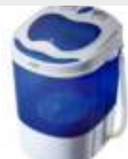
Mini washing machine with spinning function AD 8051