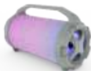
Bluetooth Speaker AD 1169