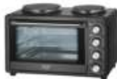
Electric Oven With HOB AD 6020