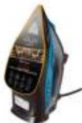
Steam Iron AD 5032