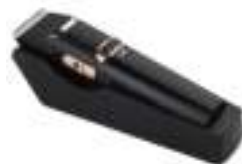
Hair Clipper AD 2832