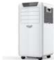
Air Conditioner AD 7916