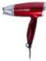
Hair Dryer AD 2220