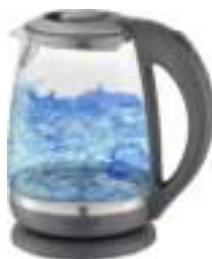
Kettle AD 1286