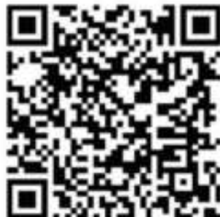
Google Play link