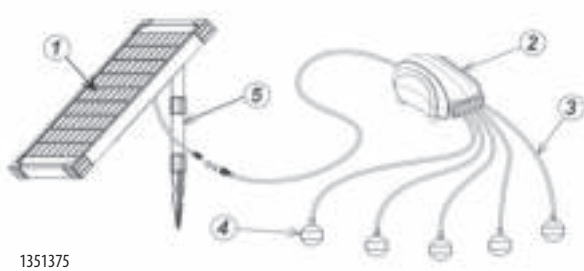
Air Solar 600 Outdoor