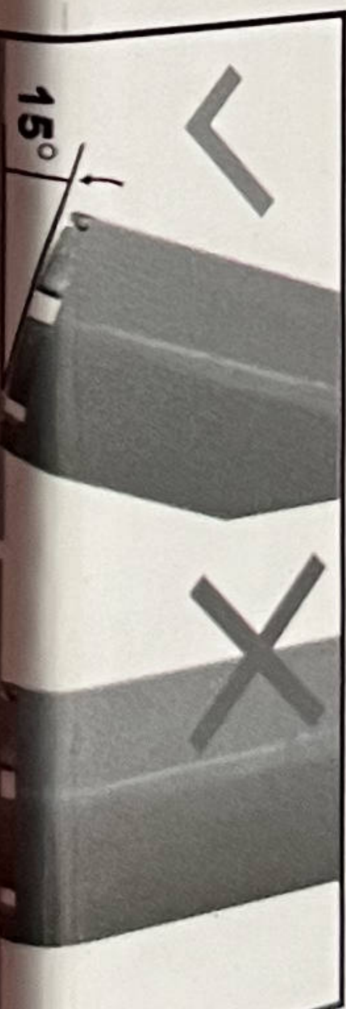
Boor de 1e aanzet in een hoek van 15 graden

INDUSTRIAL CORE DRILLS FOR PROFESSIONAL USE