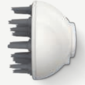
Vibrating scalp massager