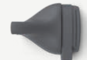
Styling nozzle 7mm