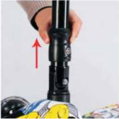
Stap 1: Open het slot en til het op