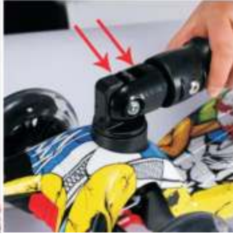
Stap 2: Vouw de stang op en duw hem naar beneden