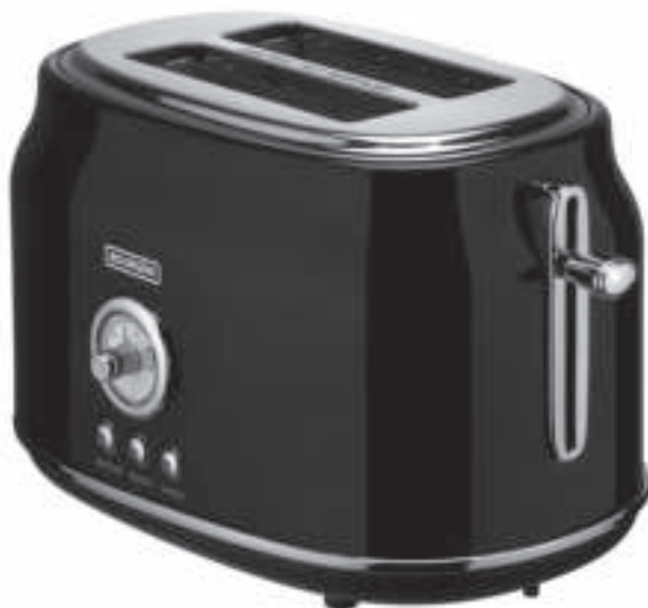
14.8001.00.00 Retro Toaster Black