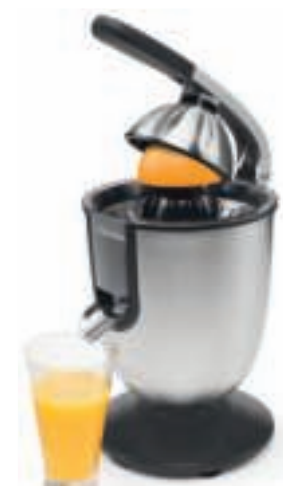
Champion Juicer 01.201852.01.001

PARTS DESCRIPTION / ONDERDELENBESCHRIJVING / DESCRIPTION DES PIÈCES / TEILEBESCHREIBUNG / DESCRIPCIÓN DE LAS PIEZAS / DESCRIÇÃO DOS COMPONENTES / DESCRIZIONE DELLE PARTI / BESKRIVNING AV DELAR / OPIS CZĘŚCI / POPIS SOUČÁSTÍ / POPIS SUČASTI