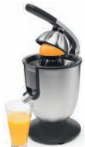
Champion Juicer 01.201852.01.001

PARTS DESCRIPTION / ONDERDELENBESCHRIJVING / DESCRIPTION DES PIÈCES / TEILEBESCHREIBUNG / DESCRIPCIÓN DE LAS PIEZAS / DESCRIÇÃO DOS COMPONENTES / DESCRIZIONE DELLE PARTI / BESKRIVNING AV DELAR / OPIS CZĘŚCI / POPIS SOUČÁSTÍ / POPIS SUČASTI