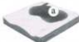
GEL AIR 2D