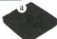
VISCO MOUSS avec BUTEE