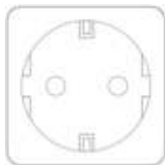
Smart Plug Gebruikershandleiding