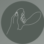
Zo houd je hem vast