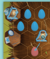
Voorbeeld achteruitslaan De kleine blauwe karekiet is verplicht om het rode ei te slaan. Hierna eindigt de beurt van de blauwe speler.

Bevindt een tegenstander zich dichtbij genoeg dat je kan slaan, dan moet je slaan. Voor eieren betekent dit dat een tegenstander zich in een naburig vakje moet bevinden. Bij de kleine karekieten en koekoeks zijn ook tegenstanders op twee stappen afstand binnen bereik. De kleine karekieten en koekoeks mogen er dus niet voor kiezen om maar één stapje te doen als ze door twee stapjes te doen een tegenstander kunnen slaan. Zijn er meerdere tegenstanders binnen bereik, dan mag je zelf kiezen welke tegenstander je slaat. Naar achteren slaan is ook mogelijk. Na het slaan van een tegenstander eindigt je beurt, je mag niet verder bewegen.