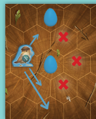
Voorbeeld van bewegen zonder te slaan De kleine karekiet mag één of twee stappen zetten. Hierbij mag hij niet over andere stukken springen en alleen in een rechte lijn bewegen. Andere spelstukken blokkeren dus de beweging.

Bevindt zich geen tegenstander dichtbij genoeg, dan mag je vrij kiezen welk spelstuk je wilt bewegen. Hierbij gelden wel de regels dat je een spelstuk alleen naar voren mag bewegen en niet over een ander spelstuk heen mag laten springen. Na het bewegen van één spelstuk eindigt je beurt.