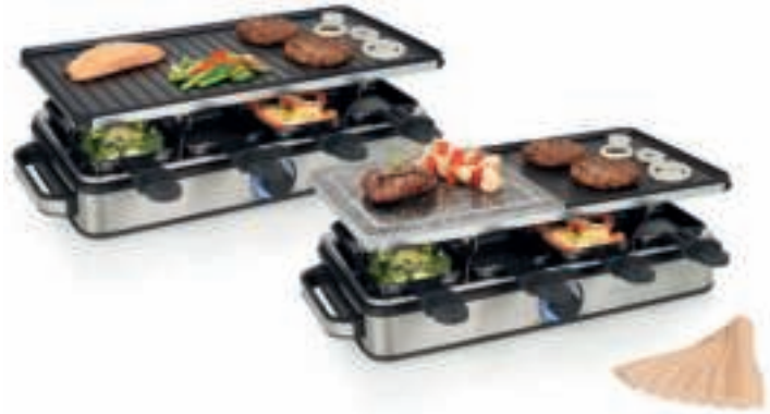
Raclette 8 Stone and Grill Deluxe Raclette 8 Grill Deluxe 01.162635.01.001 / 01.162645.01.001

PARTS DESCRIPTION / ONDERDELENBESCHRIJVING / DESCRIPTION DES PIÈCES / TEILEBESCHREIBUNG / DESCRIPCIÓN DE LAS PIEZAS / DESCRIÇÃO DOS COMPONENTES / DESCRIZIONE DELLE PARTI / BESKRIVNING AV DELAR / OPIS CZĘŚCI / POPIS SOUČÁSTI / POPIS SUČASTI / ОПИСАНИЕ ЗАПЧАСТИ