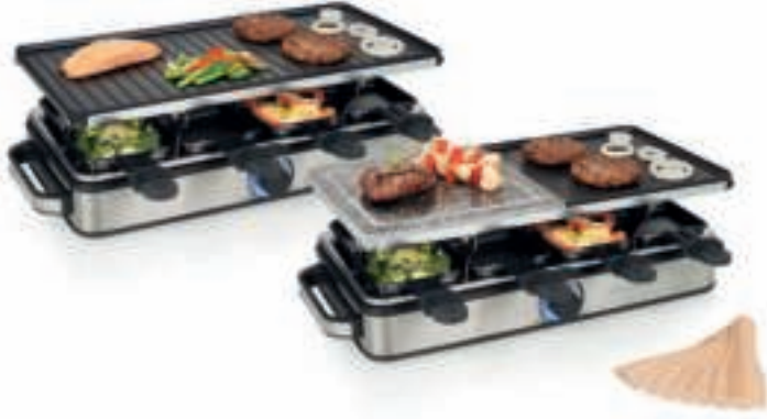
Raclette 8 Stone and Grill Deluxe Raclette 8 Grill Deluxe 01.162635.01.001 / 01.162645.01.001

PARTS DESCRIPTION / ONDERDELENBESCHRIJVING / DESCRIÇÃO DAS PEÇAS / TEILBESCHREIBUNG / DESCRIPCIÓN DE LAS PIEZAS / DESCRIÇÃO DOS COMPONENTES / DESCRIZIONE DELLE PARTI / BESKRIVNING AV DELAR / OPIS CZĘŚCI / POPIS SOUČÁSTI / POPIS SUČASTI / ОПИСАНИЕ ЗАПЧАСТИ