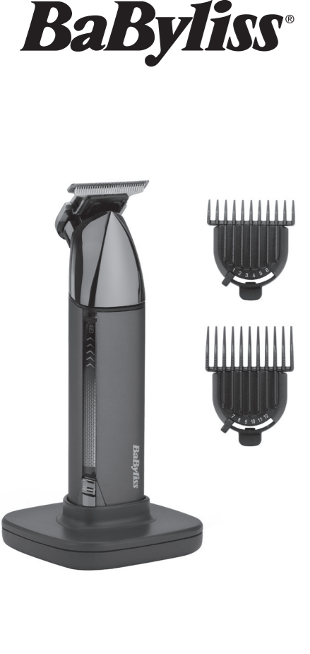
Made in China Fabriqué en Chine