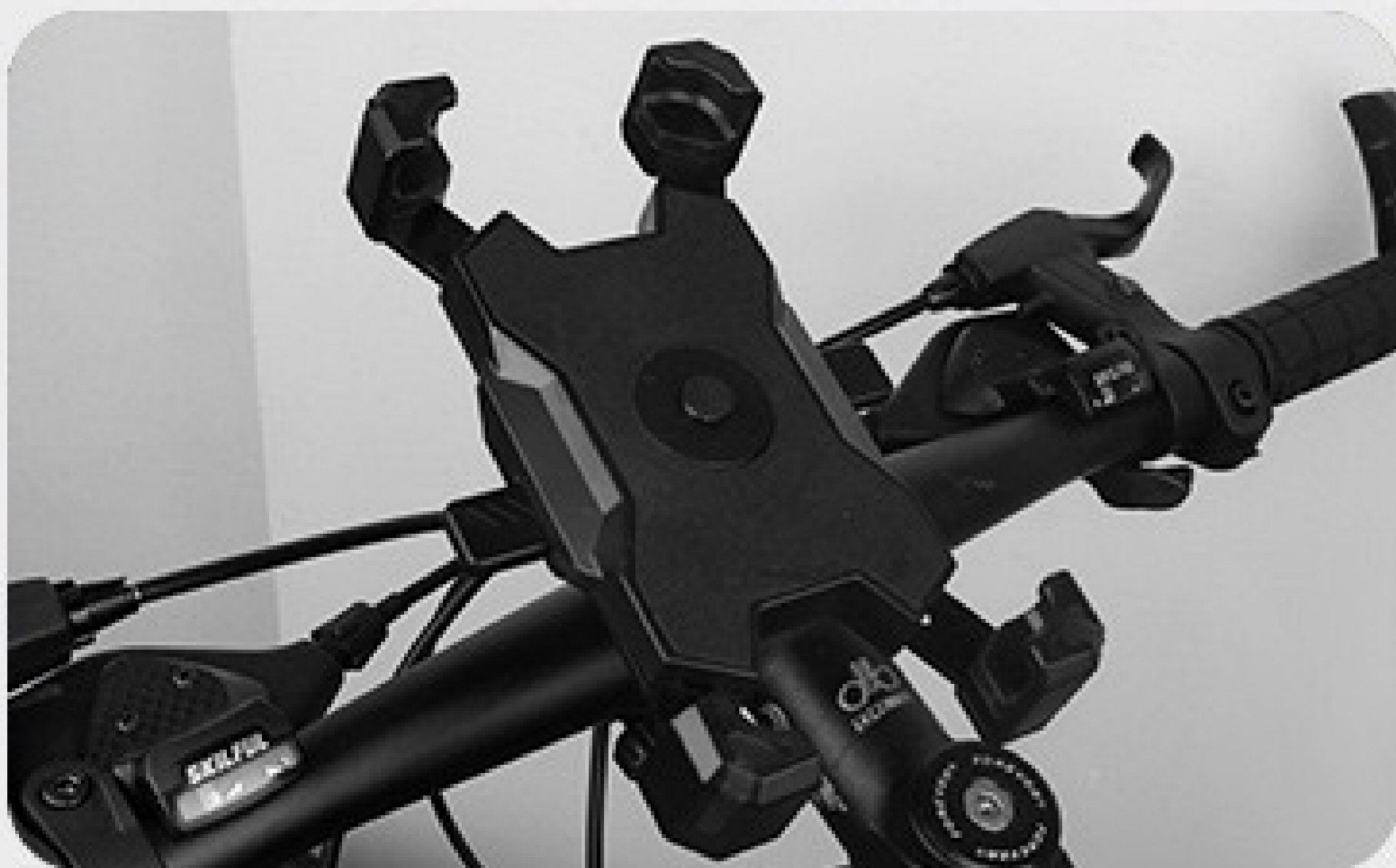
3. Pas de hoek aan en druk op de zijkanten om de telefoonhouder te openen.