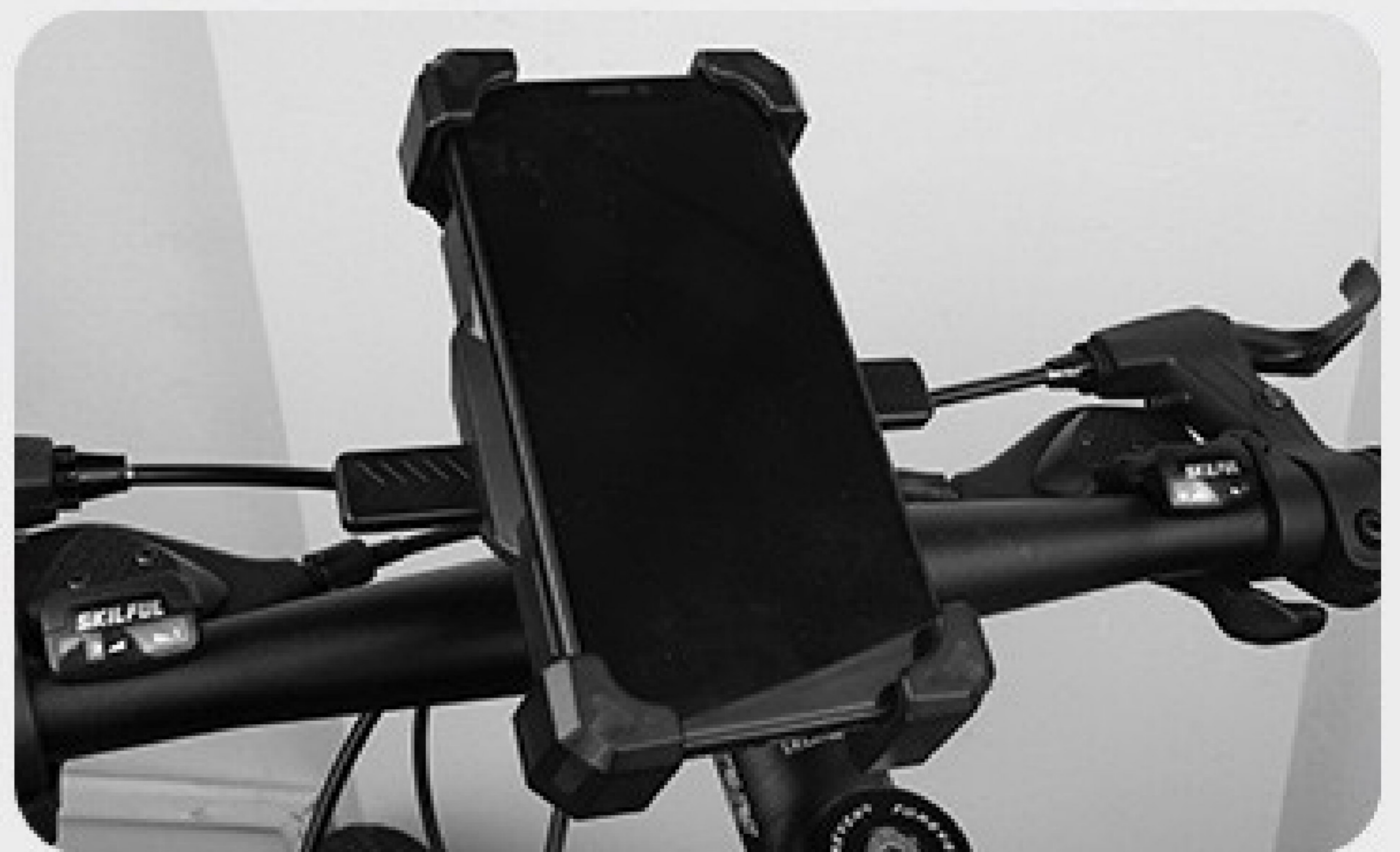
4. Druk de mobiele telefoon op de telefoonhouder.