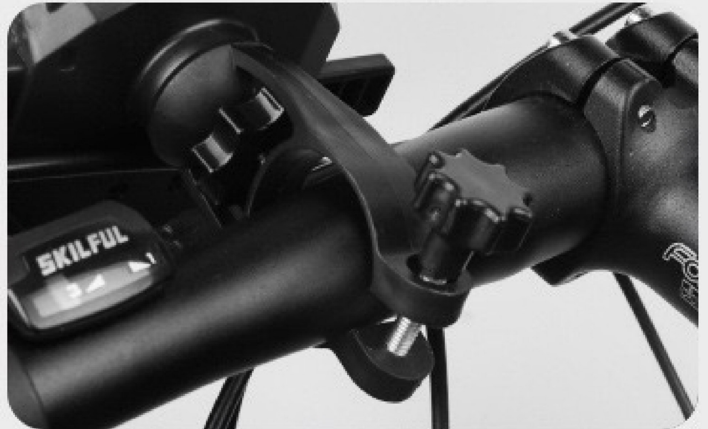
2. Draai de schroeven vast. de telefoonhouder.