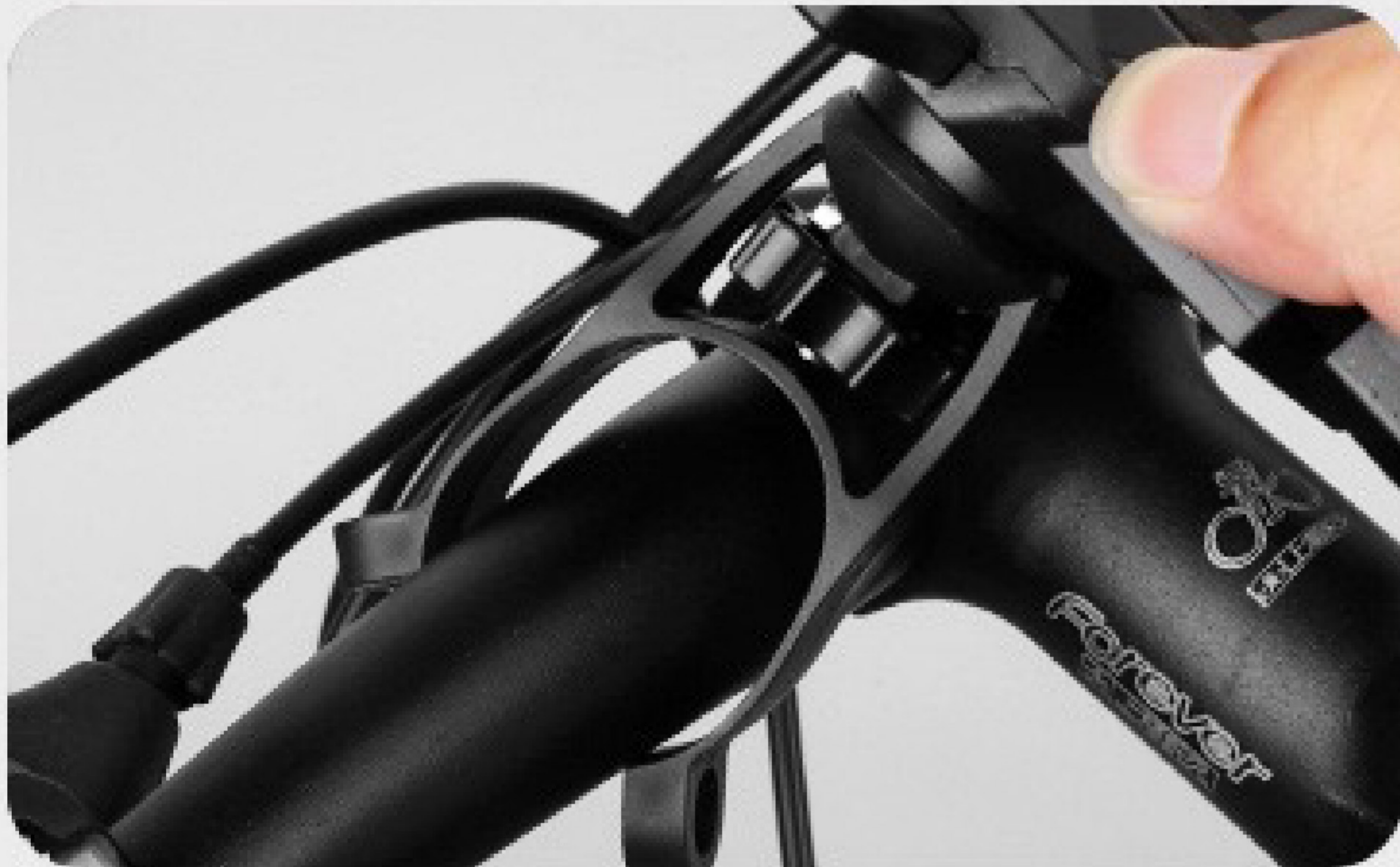
1. Bevestig het op het stuur.

Geschikt voor sturen met een diameter van minder dan 3 cm.