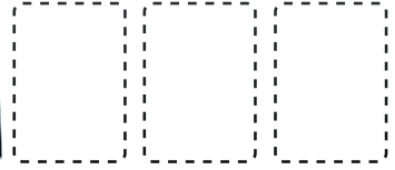
afleggebied met 3 velden