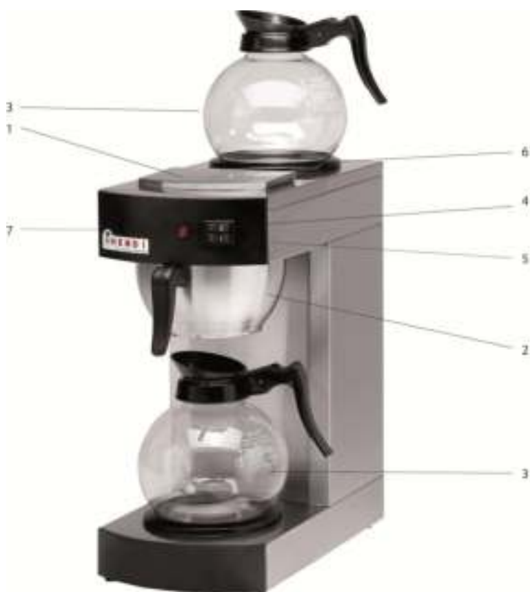
Rysunek 1 208304

Przed podłączeniem, sprawdź przy pomocy poniższej listy kontrolnej, czy poprawnie dostarczono wszystkie części urządzenia (rodzaj, ilość).