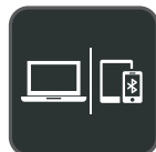
Verbinding met meerdere apparaten