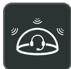
Acoustic Shield Technology

De Yealink WH66 is met de twee modellen WH66 Dual en WH66 Mono dé draadloze DECT-headset binnen de huidige markt die een geheel nieuwe vorm van samenwerking via desktop mogelijk maakt. Werkt naadloos samen met de gangbare UC-platforms en biedt standaardintegratie met Yealink IP-telefoons. Het capacitieve touchscreen van 4,0 inch (480 x 800 pixels) op het basisstation biedt u een vernieuwde werkwijze waarbij u de volledige controle hebt via simpele aanrakingen. Alsof u zelf een telefooncentrale bent, handelt u telefoongesprekken af, maakt u verbinding met verschillende apparaten (bureautelefoon/mobiele telefoon/computer), laadt u uw mobiele telefoon draadloos op en neemt u zelfs de taak van de speakertelefoon over. En om dit multifunctionele werkstation in werking te stellen, hoeft u deze alleen maar in het stopcontact te steken. Zo eenvoudig is het om uzelf van alle gemakken te voorzien.