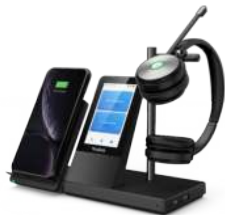
WH66 Mono/Dual: Teams WH66 Mono/Dual: UC