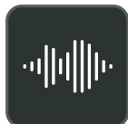
Optima Audio Experience