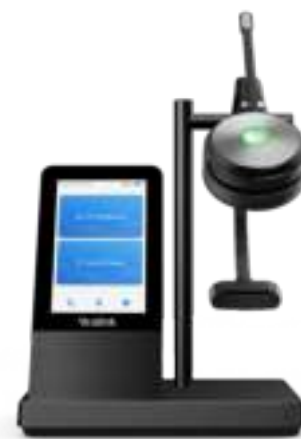
WH66 met oplader *Draadloze oplader is optioneel

In de WH66 is het bezig-lampje ingeschakeld. Als het lampje op de headset of BLT60 op het bureau rood gaat branden, weten omstanders dat u in gesprek bent en zullen ze u niet onbedoeld storen. Zo houdt u uw aandacht bij het gesprek, wat de communicatie efficiënter en de samenwerking beter maakt.