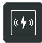
Draadloze Qi- oplader