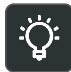
Persoonlijk in te stellen bezig-lampje