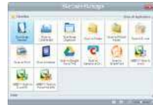
Menu rapide pour les fonctionnalités Mac OS et autres applications