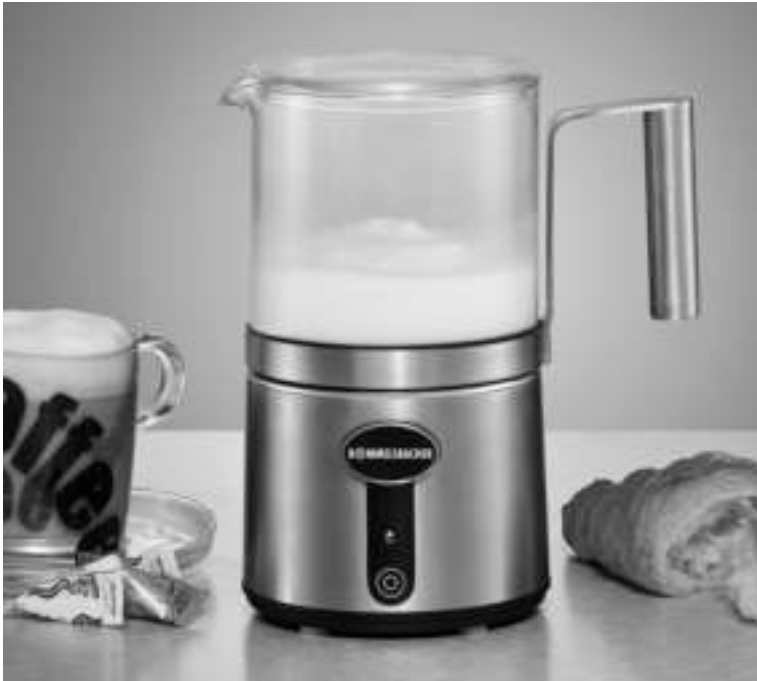
MS 650 Milchaufschäumer Milk frother