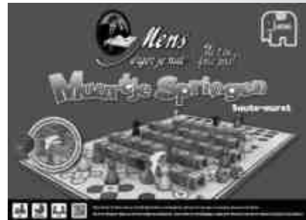
Mens Erger Je Niet! Muurtje Springen 18128