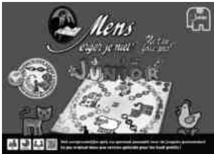
Mens Erger Je Niet! Junior 18144