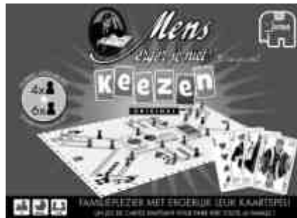
Mens Erger Je Niet! Keezen 18143

Kijk voor een compleet overzicht van alle Jumbo spellen en verkoopadressen op: www.jumbo.eu