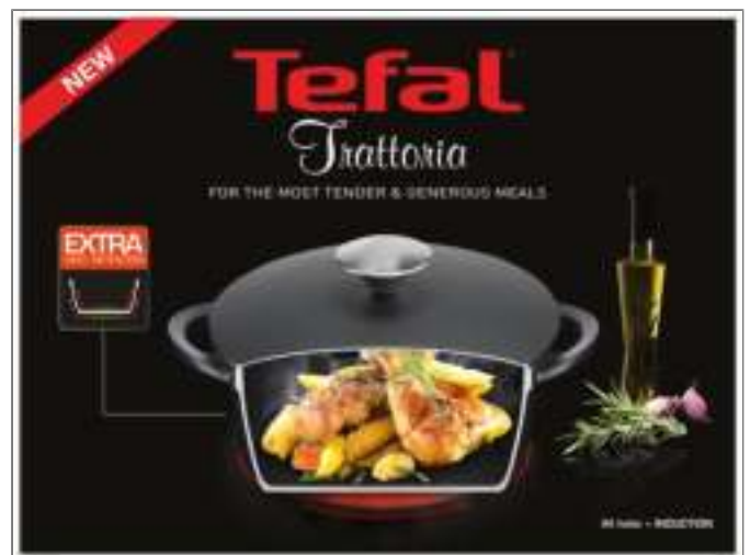
Trattoria hapjespan 28 cm Hapjespan 28 cm E2187274