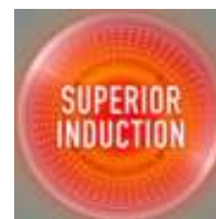
Optimale inductiebodem voor snelle verhitting

Geschikt voor alle warmtebronnen (gas, elektrisch, keramisch) en inductie.