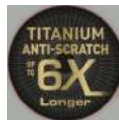
Onze beste krasbestendige Titanium coating

De hoogwaardige Titanium Unlimited coating in de koekenpannen gaat tot 6x langer mee vergeleken onze basis Titanium coating.* Dankzij de Titanium deeltjes kun je zelfs metalen spatels in deze pan gebruiken.