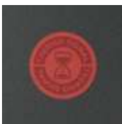
Thermo-Signal™ voor perfecte resultaten

De hoogwaardige Titanium Unlimited coating in de koekenpannen gaat tot 6x langer mee vergeleken onze basis Titanium coating.* Dankzij de Titanium deeltjes kun je zelfs metalen spatels in deze pan gebruiken.