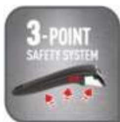
Stevige verwijderbare handgreep voor optimale ruimtebesparing

Koken van een leien dakje, elke dag weer! Alles wat je nodig hebt om je dagelijkse tijd in de keuken te vereenvoudigen: een magische verwijderbare handgreep, een ovenbestendige en koelkastklare* pan mét een ruimtebesparend stapelbaar ontwerp.