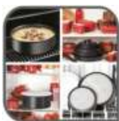
De pan die alles kan!

**Voorkeur geniet om pan met de hand af te wassen, voor een langere levensduur.