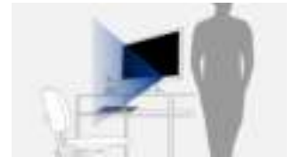
Sensor herkent verlaten werkplek