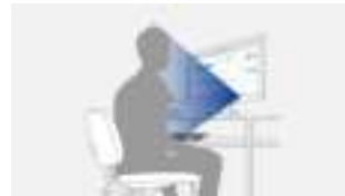
Sensor herkent persoon op werkplek

Met de aanwezigheidssensor (EcoView-Sense) bespaart u stroom en verlaagt u uw energiekosten. Het principe erachter: Als u achter het beeldscherm zit, staat de monitor aan. Als u uw werkplek verlaat, schakelt het beeldscherm automatisch over op de spaarmodus. Zodra u terugkeert, wordt het beeldscherm weer actief, volledig automatisch met behulp van de bewegingssensor.