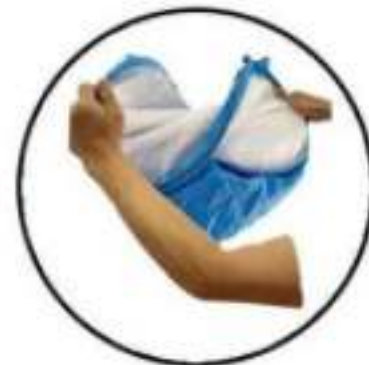
Stap 5: Draai de hoeken naar elkaar