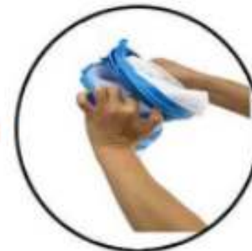
Stap 6: Vouw in een cirkel