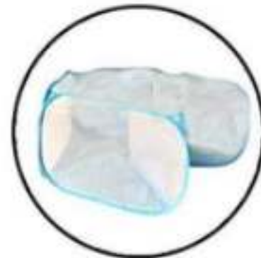
Stap 2: Vouw de hoeken naar elkaar