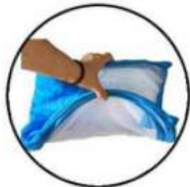
Stap 4: Vouw het naar elkaar