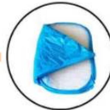
Stap 3: Vouw het zeil in een punt