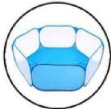
Stap 1: Volledig opgezet