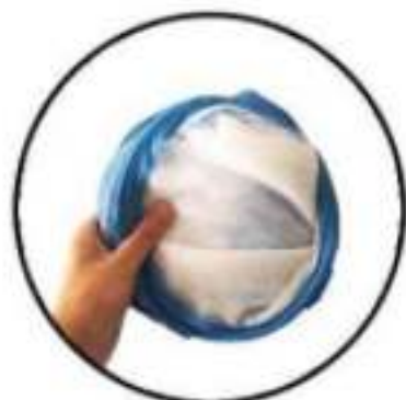
Stap 7: Opgevouwen