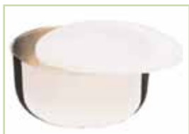
Multifunctionele roestvrijstalen kom. Rijst, saus, opwarmen van gerechten enz.