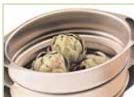
bovenste schaal met uitneembare bodem