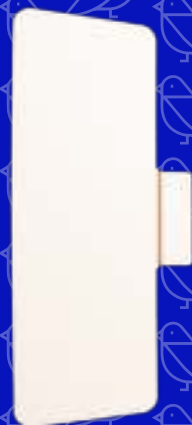
1 x toetsenbord blad