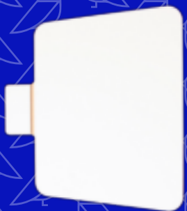
1 x scherm blad