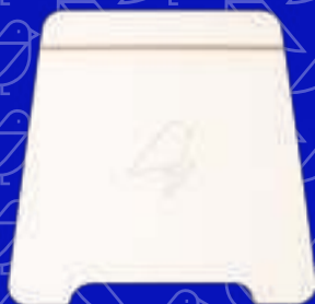
1 x voeiplaat