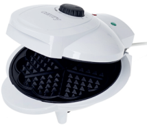
Waffle maker CR 3022