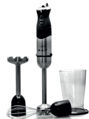
Hand blender CR 4612