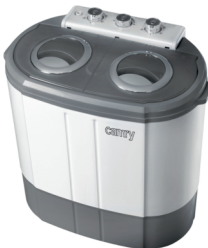
Washing + spinning mashine CR 8052