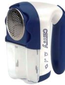
Lint remover CR 9606