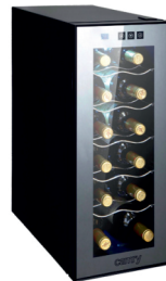
WINE COOLER CR 8068