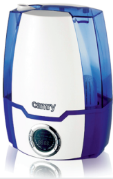
Air humidifier CR 7952