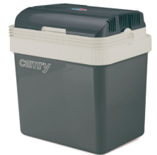
Portable cooler CR 93