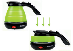
Headphones CR 1146