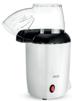
Popcorn maker CR 4458