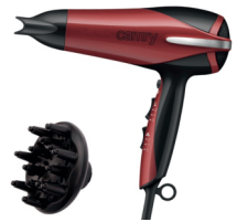
Hair dryer CR 2241