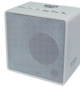
Cube Radio CR 1165