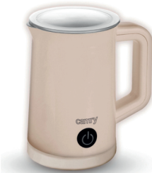
Automatic milk frother CR 4464