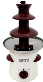
Chocolate fountain CR 4457