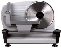
Meat slicer CR 4702