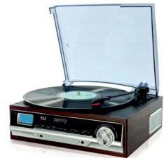
Turntable with radio/USB/SD CR 1114