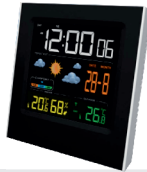
Weather Station CR 1166