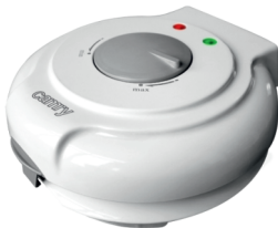
Cone maker CR 3028