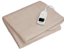
Electric blanket CR 7407