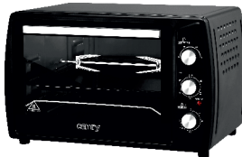
ELECTRIC OVEN CR 6017