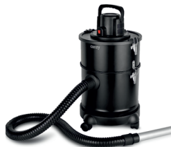
Ash Vacuum CR 7030