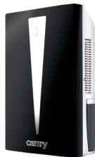
Air dehumidifier CR 7903