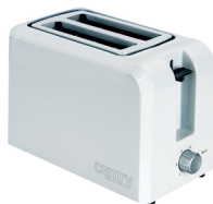
Toaster CR 3209