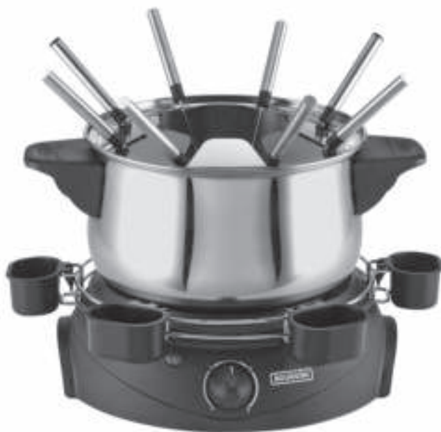
17.2600.00.00 Classic Fondue 8P