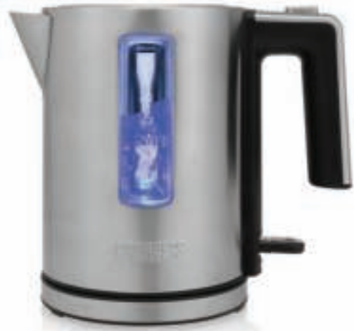
Steel Kettle 1 L Deluxe 01.236045.01.001

PARTS DESCRIPTION / ONDERDELENBESCHRIJVING / DESCRIPTION DES PIÈCES / TEILEBESCHREIBUNG / DESCRIPCIÓN DE LAS PIEZAS / DESCRIÇÃO DOS COMPONENTES / DESCRIZIONE DELLE PARTI / BESKRIVNING AV DELAR / OPIS CZĘŚCI / POPIS SOUČÁSTI / POPIS SUČASTI / ОПИСАНИЕ ЗАПЧАСТІ