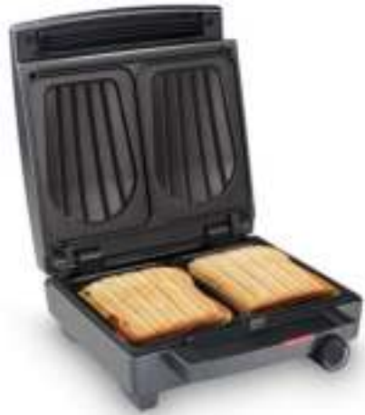
Sandwich Maker SW 1451