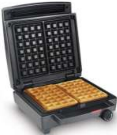
Waffle Maker WA 1451