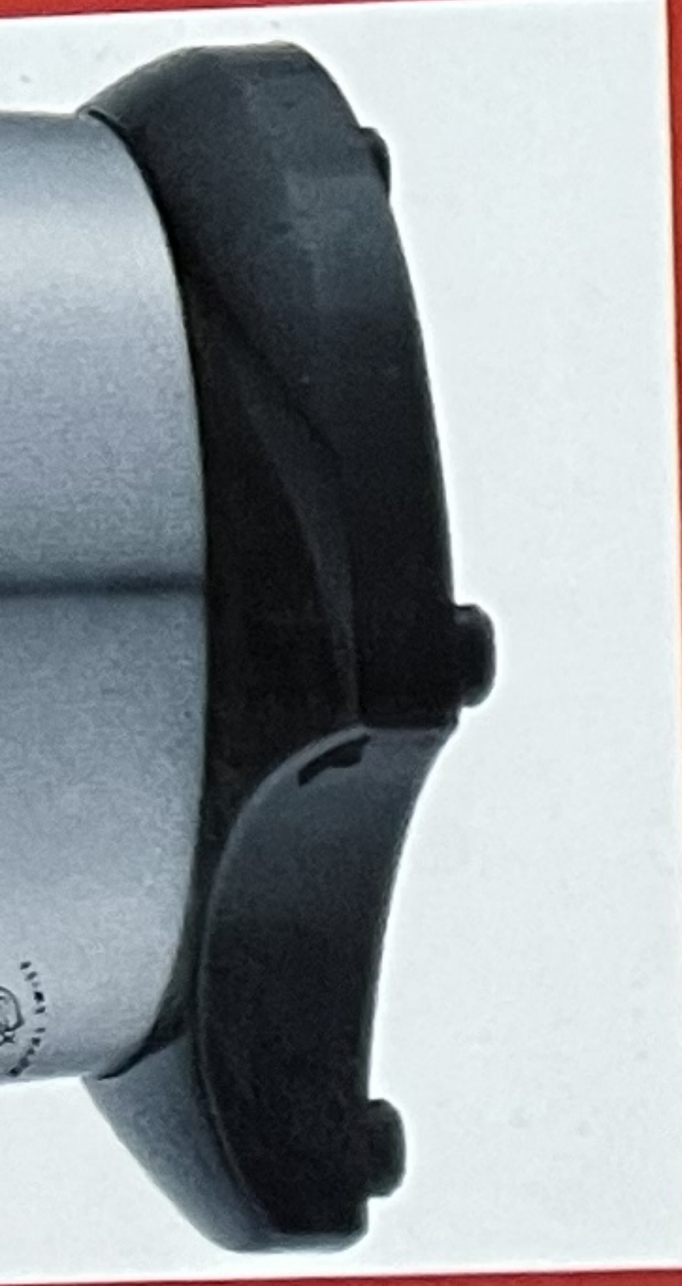
SS body with curve base