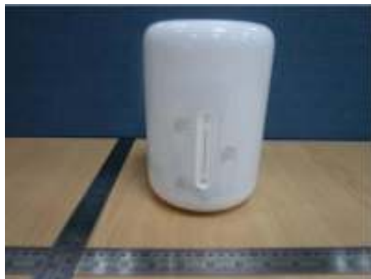
Imagen en color del producto: