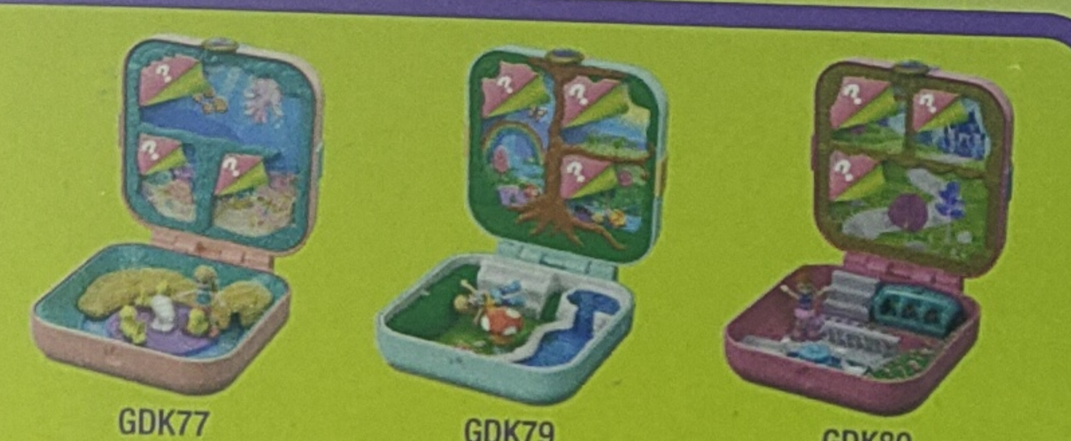
GDK77 GDK79 GDK80

3 ACCESSORIES! • 3 ACCESSOIRES! • 3 ZUBEHÖRTEILE! 3 ACCESSORI! • 3 ACCESSOIRES! • 3 ACCESORIOS! 3 ACCESSÓRIOS! • 3 TILBEHØR! • 3 TARVIKETTA! 3 TILBEHØRSDELE! • 3 TILBEHØR! • 3 AKCESORIA! 3 DOPLŇKY! • 3 DOPLŇKY! • 3 KIEGÉSZÍTŐ! • 3 AKCESOVA! 3 ΑΞΕΣΟΥΑΡ! • 3 AKSESUAR! • 3 اكسسوارات