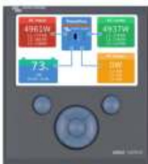
Color Control GX met een PV-toepassing

Indien aangesloten op het Ethernet zijn systemen met een Color Control GX en andere GX apparaten toegankelijk en kunnen instellingen worden gewijzigd.