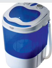
Mini washing machine with spinning function AD 8051