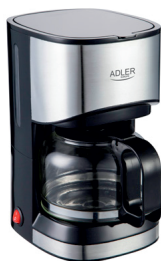
Dripp Coffee Maker AD 14407