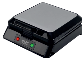
Waffle Maker AD 3036