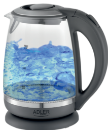
Kettle AD 1286