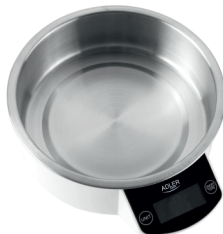
Kitchen Scale AD 8121