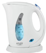
Electric Kettle AD 02