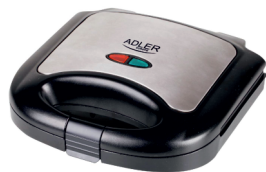
Sandwich maker AD 3015