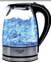
Electric Kettle AD 1225