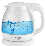
Water Kettle 1,0L AD 1283