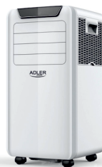
Air Conditioner AD 7916