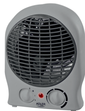
Fan Heater AD 7717