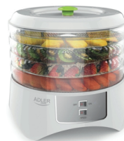
Food dryer AD 6654