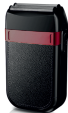
Hair Shaver AD 2932