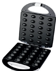
Nut Cookie Maker AD 3039