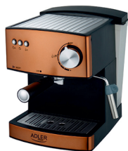
Espresso Machine AD 4404