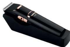
Hair Clipper AD 2832