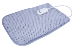
Electric heating pad AD 7415