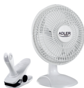
Desk fan 15 cm with clip AD 7317