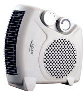
Diet Kitech Scale AD 3133