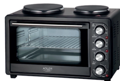
Electric Oven With HOB AD 6020