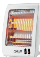
Quartz Heater AD 7709