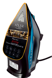
Steam Iron AD 5032