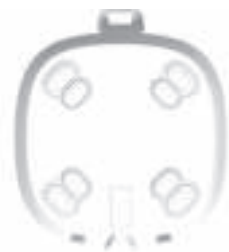
2. DE MONTAGEPLAAT