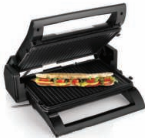
MULTI GRILL 2-in-1 01.112530.01.001

PARTS DESCRIPTION / ONDERDELENBESCHRIJVING / DESCRIPTION DES PIÈCES / TEILEBESCHREIBUNG / DESCRIPCIÓN DE LAS PIEZAS / DESCRIÇÃO DOS COMPONENTES / DESCRIZIONE DELLE PARTI / BESKRIVNING AV DELAR / OPIS CZĘŚCI / POPIS SOUČÁSTÍ / POPIS SÚČASTÍ / ОПИСАНИЕ ЗАПЧАСТИ