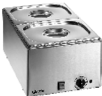
200.232 2 x 1/2 GN