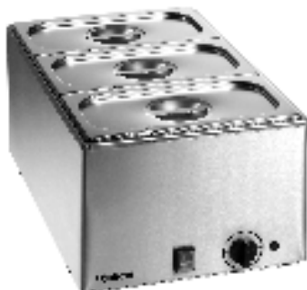
200.233 3 x 1/3 GN