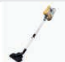
Bagless Vacuum AD 7036