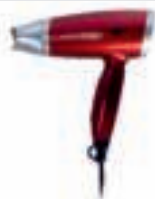
Hair Dryer AD 2220