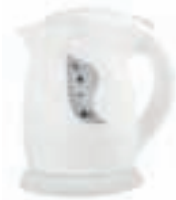
Electric Kettle AD 08