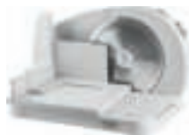
Food Slicer AD 4701