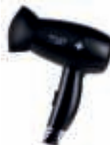
Hair Dryer AD 2251