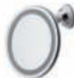
Led Bathroom Mirror AD 2168