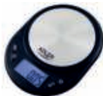
Precision scale AD 3162