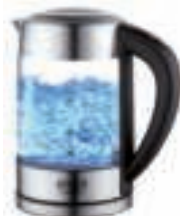
Water Kettle AD 1247 NEW