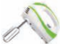
Mixer AD 4205