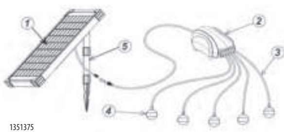
Air Solar 600 Outdoor