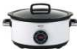
Slow Cooker CR 6410