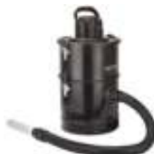
Ash Vacuum 25L 1200W CR 7030