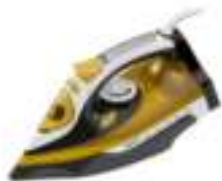
Steam Iron CR 5029