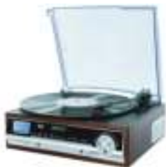
Turntable CR 1113