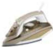
Steam iron CR 5018