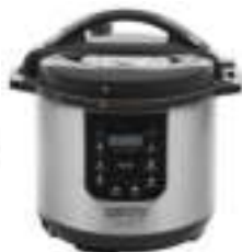
Pressure cooker CR 6406