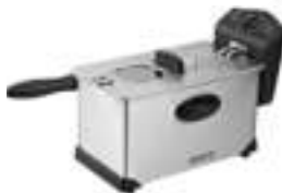
Deep Fryer 3L CR 4909