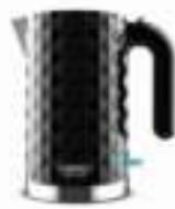
Electric Kettle CR 1169