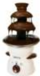
Chocolate Fountain CR 4457