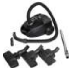
Super silent vacuum cleaner CR 7037