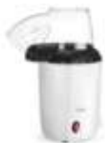
Popcorn maker CR 4458