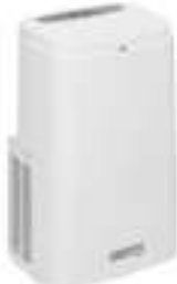
Air conditioner CR 7907