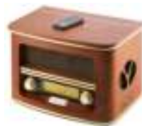
Retro radio CR 1109