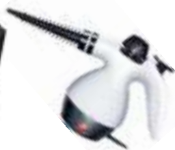
Steam Cleaner CR 7021