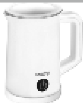
Milk Frother CR 4464