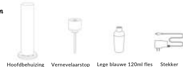
Hoofdbehuizing Vernevelaarstop Lege blauwe 120ml fles Stekker