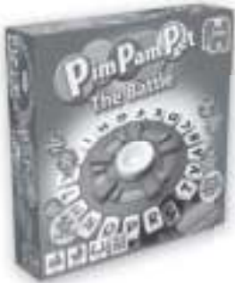
17729 PPP The Battle