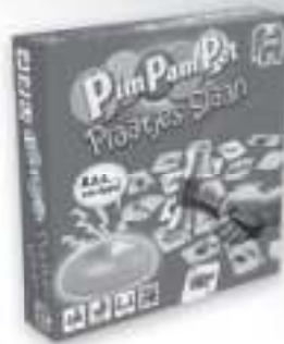
17855 PPP Plaatjes Slaan

Kijk voor een compleet overzicht van alle Jumbo spellen en verkoopadressen op: www.jumbo.eu